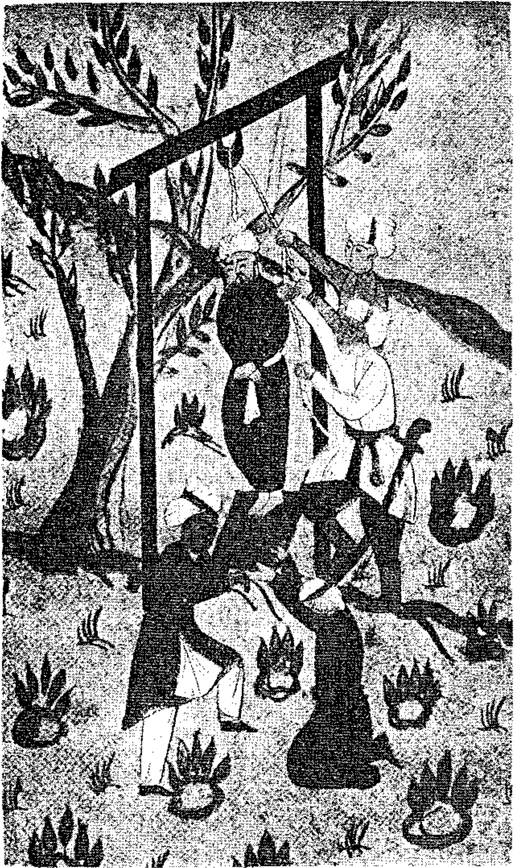
لوحة «مينياتور» هندية فارسية من القرن الثاني عشر هجري مجموعة